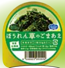
ほうれん草のごまあえ