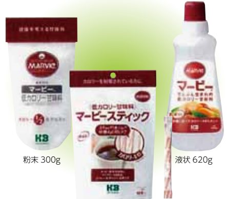
粉末 300g スティック 60本 液状 620g