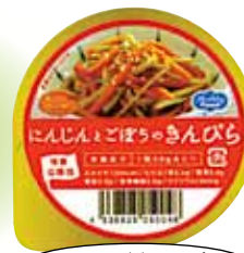
にんじんとごぼうのきんぴら