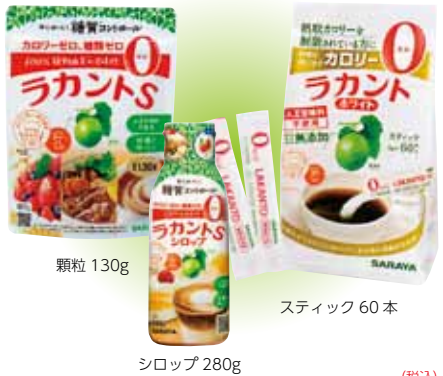
顆粒 130g スティック 60本